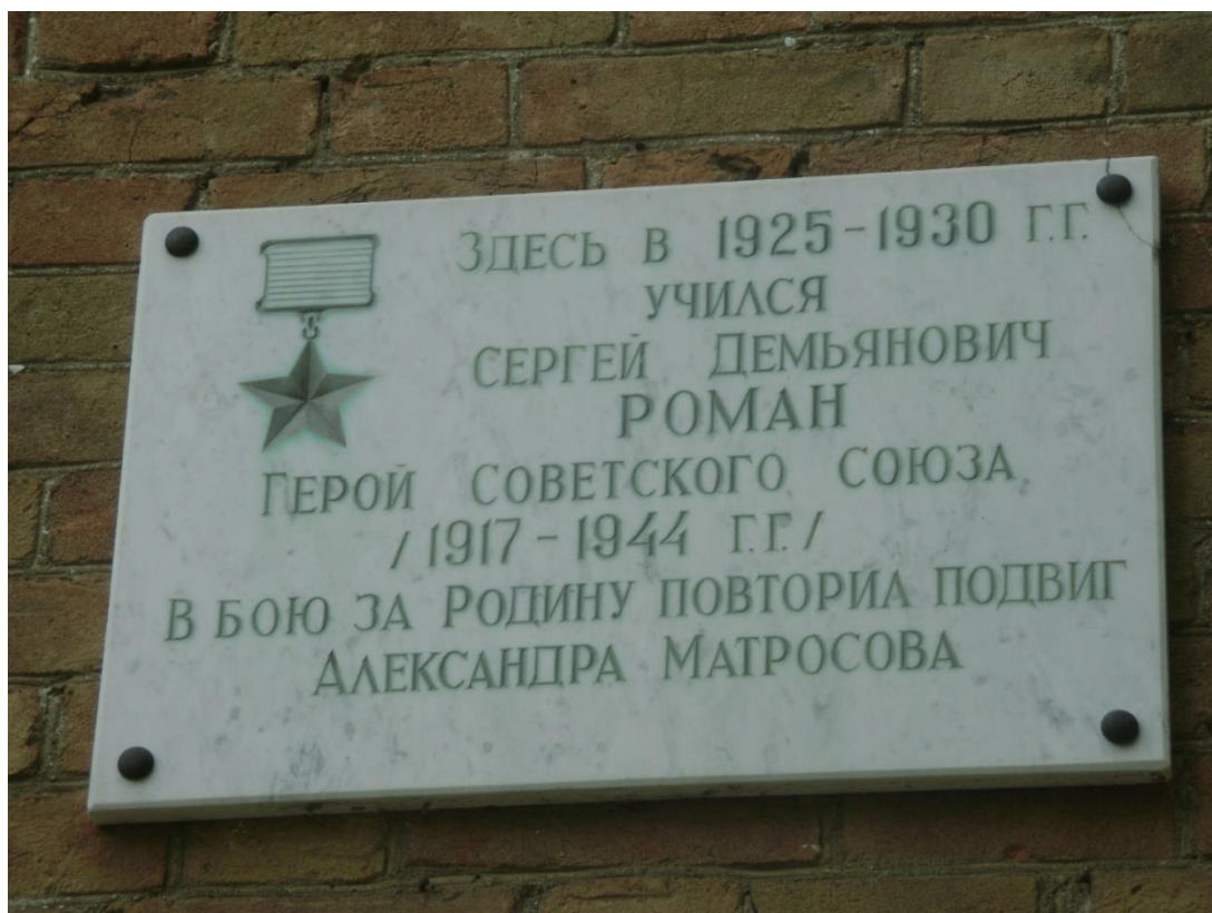
Памятная доска на здании школы в г. Ейске, где учился Герой Советского Союза С.Д. Роман