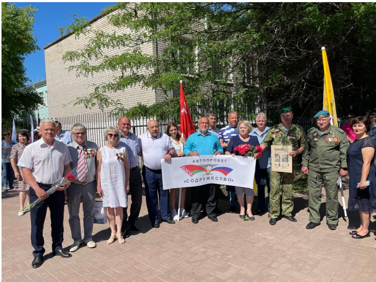
Участники митинга возле памятника С.Д. Романа, Ейск, 7 июня 2022 г.