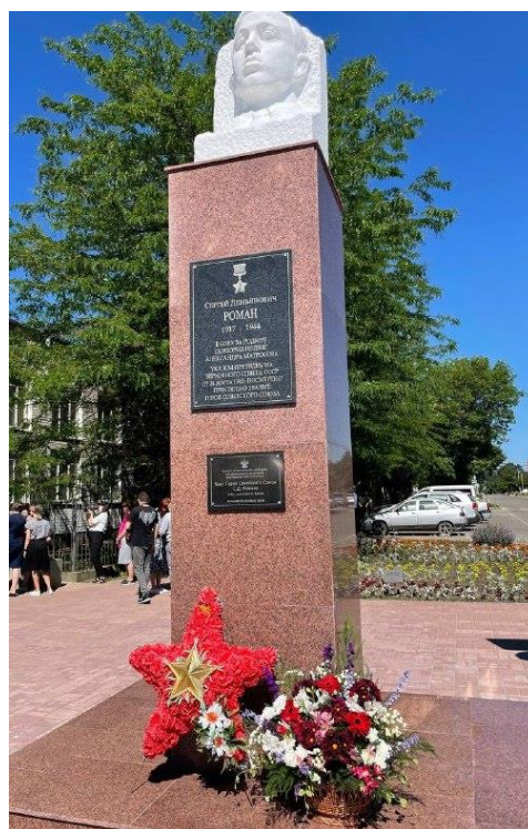
Памятник С.Д. Роману, Герою Советского Союза в г. Ейске