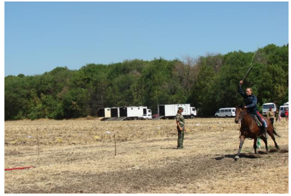
Владение копьём и рубку лозы продемонстрировали донские казаки