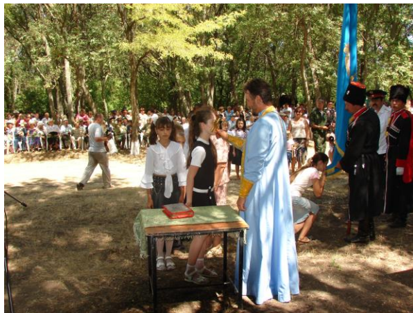
Ряды кубанских казаков пополнились