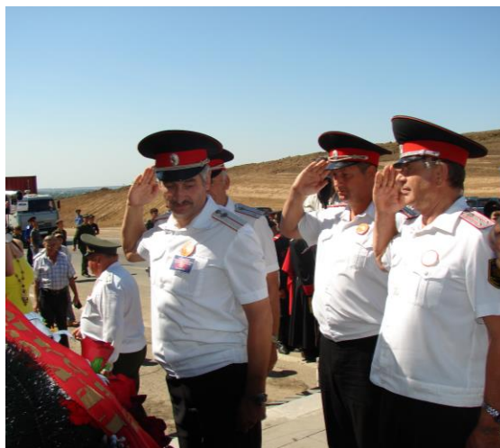
Делегация Ейского отдела возложила венок к памятнику, посвящённому героическому 4-му Гвардейскому Кубанскому казачьему кавалерийскому корпусу, 2 августа 2007 г.