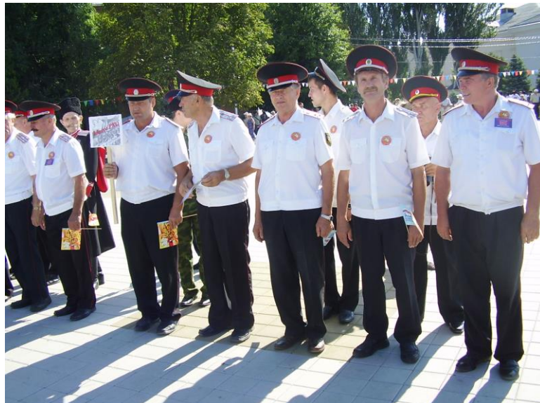
Делегация Ейского отдела Кубанского казачьего войска на праздновании 65- летия атаки под Кущёвской (2007 г.)