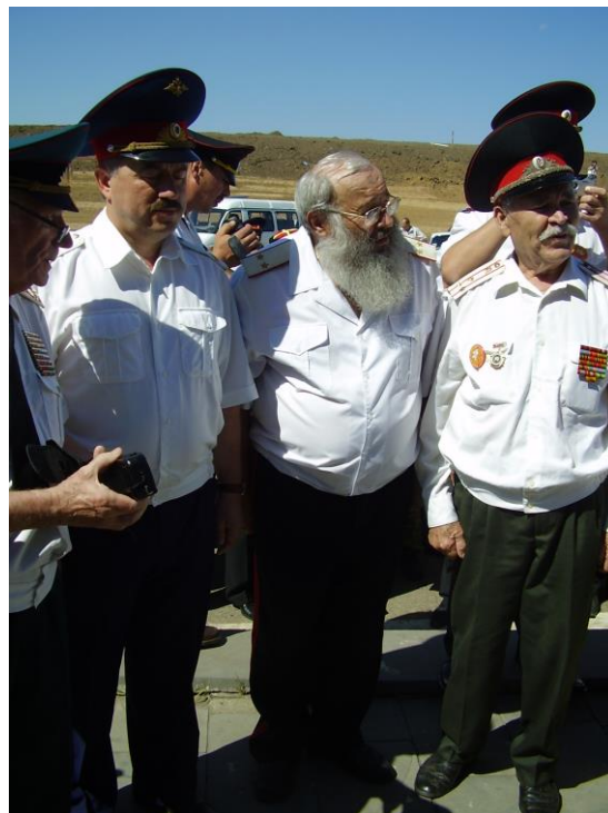
Водолацкий В.П.- атаман Всевеликого Войска Донского и Громов В.П.- войсковой атаман Кубанского казачьего войска со старейшинами на праздновании 65- летия атаки под Кущёвской (2007 г.)