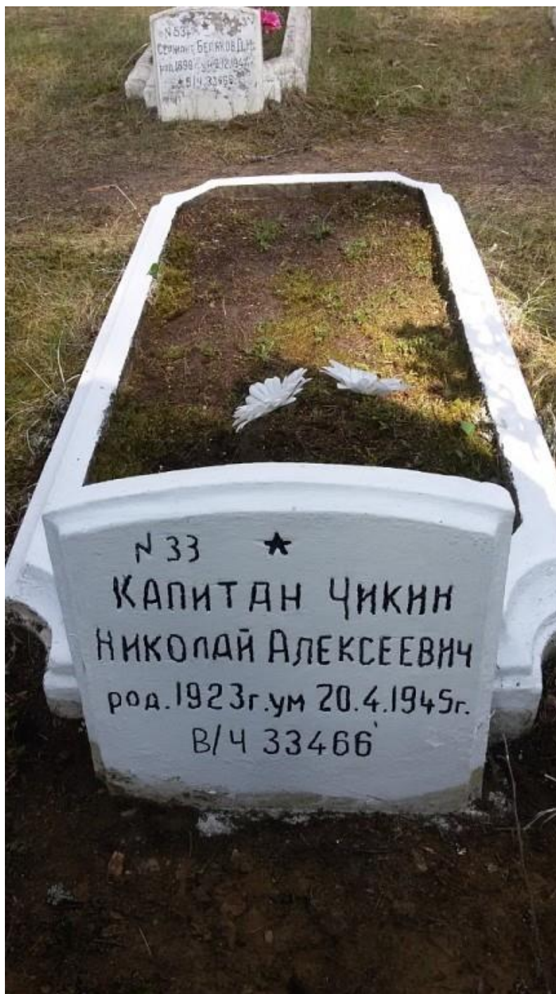
Могила Н.А. Чикина на кладбище в городе Даугавпилс