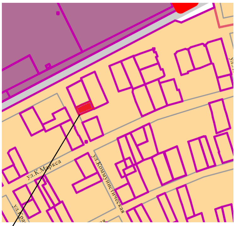
Рассматриваемый земельный участок 23:08:0704015:41