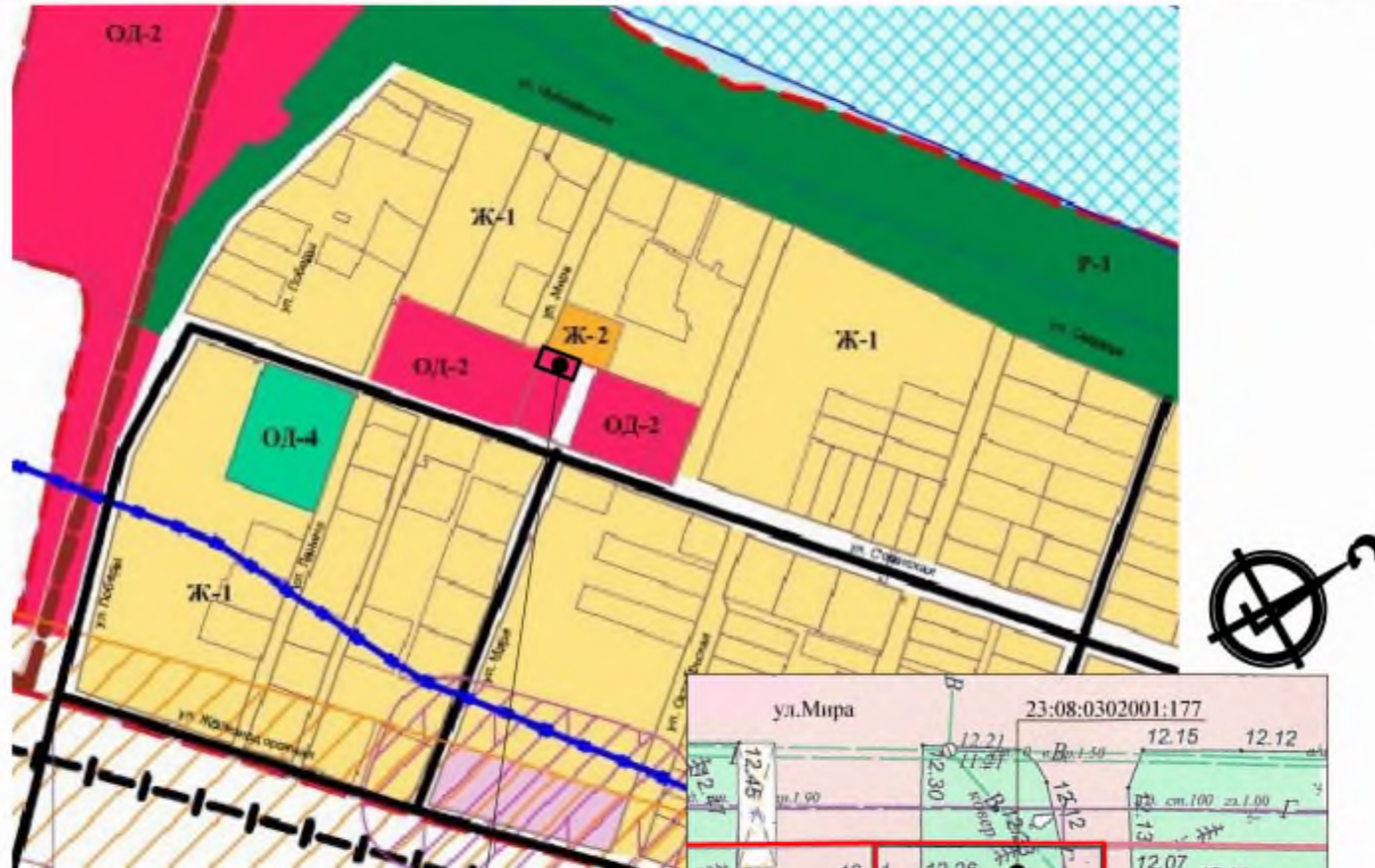
Рассматриваемый земельный участок 23:08:0302001:758

с картой зон с особыми условиями использования территории М1:2000